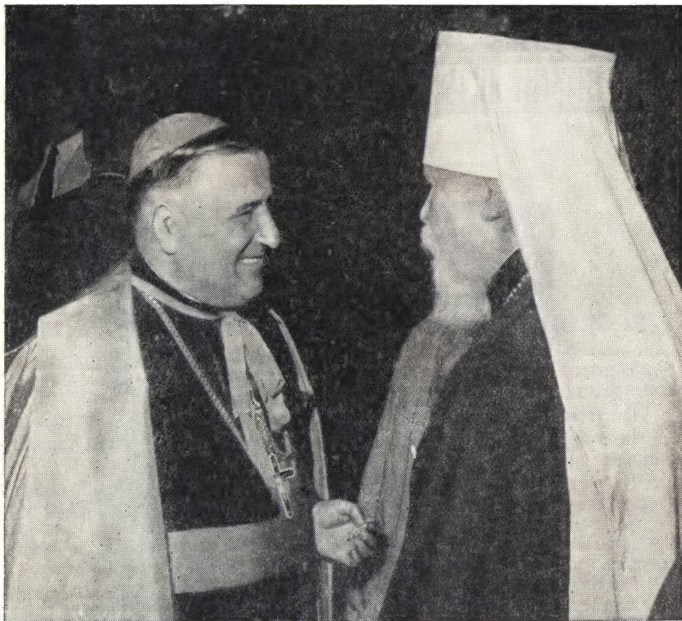
МИТРОПОЛИТ НИКОЛАЙ РАЗГОВАРИВАЕТ С ВЕНГЕРСКИМ РИМСКО-КАТОЛИЧЕСКИМ ЕПИСКОПОМ НИКОЛАЕМ ДУДАШ

секает ее на две половины — Буду и Пешт. На острове, омываемом с двух сторон водами Дуная и называемом островом Маргариты, раскинут чудесный старинный парк. В гостинице на этом острове имели свое пребывание большинство участников сессии, в числе их и я.